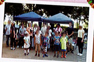
みんなでバーベキュー 9/9(土)

学生時代の物一つ一つ思い出や歴史が刻まれた 大切な品物です。次の方に使って頂けたら私たち 家族は幸せです。 南アルプス市 テニスママ