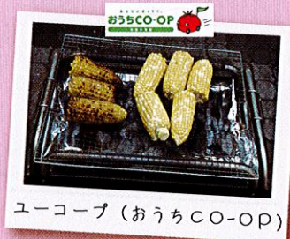
ユーコープ (おうちCO-OP)