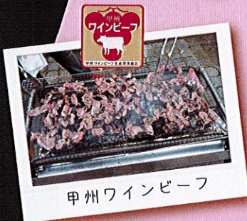
甲州ワインビーフ