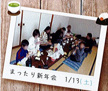
まったり新年会 1/13(土)

子供たちは友達同士でお話ながら、 大人はゆっくりお話を聞いたり、 有意義な時間も過ごせました。 ママ