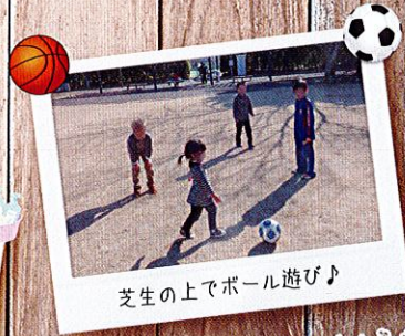
芝生の上でボール遊び♪