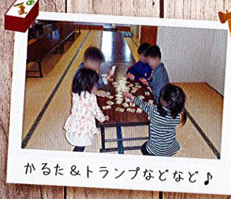
かるた&トランプなど♪

配布先は、幼稚園・保育園・小学校 で、各関係機関のご協力により全ての 家庭に配布していただいています。