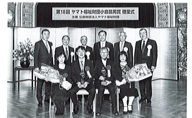
写真は第18回ヤマト福祉財団小倉昌男賞の贈呈式（平成29年12月6日）