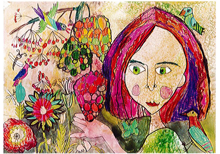
Kale Evgeniy (ロシア) 6歳