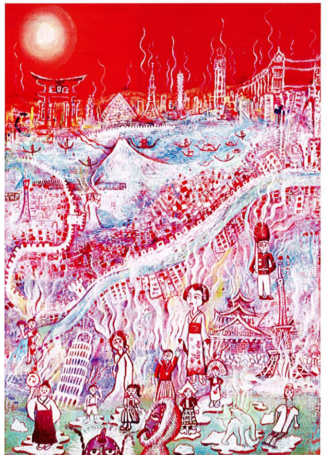
Tsal Iris (台湾) 10歳