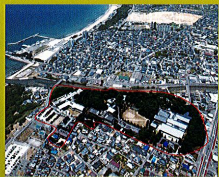
第38回 国土交通大臣賞 緑風会/恵愛会福岡病院