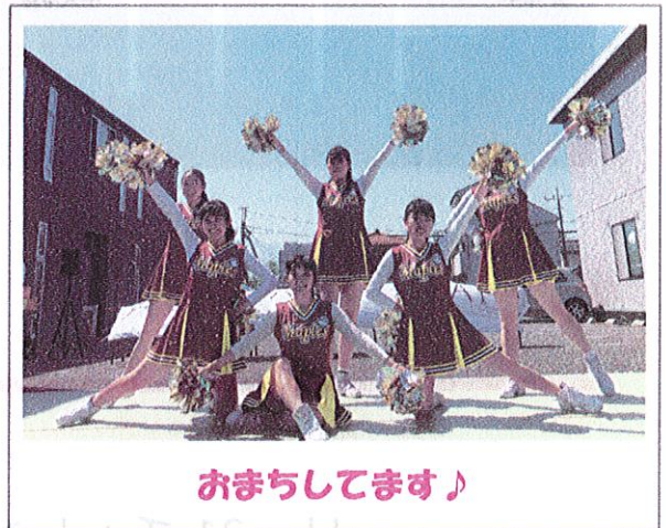
おまちしています♪

対象申込 小学4~6年生 定員20名 ※事前の申込みが必要になります。下記のお申込方法をご確認ください。 定員になり次第、締め切らせていただきます。