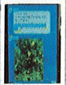
▲地域の情報発信や情報共有にLINEを活用!高校生から60代の方まで利用しています!