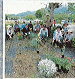
▲地域の入口にある花壇に毎年花の苗を植えています!