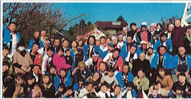
▲例大祭「五社神社の御輿」で付き歩いた子どもたちと一緒にみんなの思い出を撮りました!