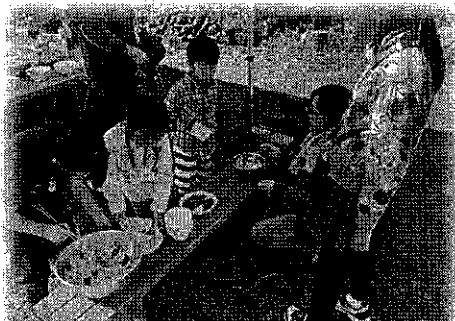
美味しいごはんをつくってみよう！