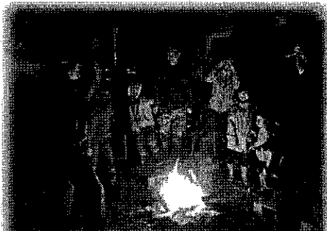
キャンプファイアを体験できる！