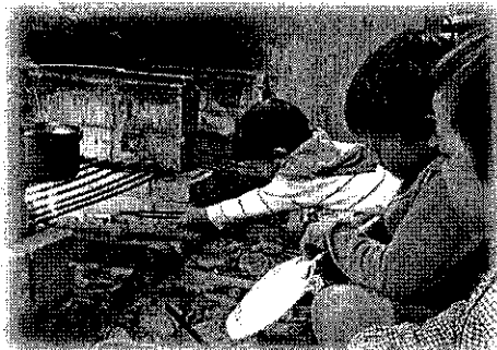
アウトドアクッキングで焚き火に挑戦！