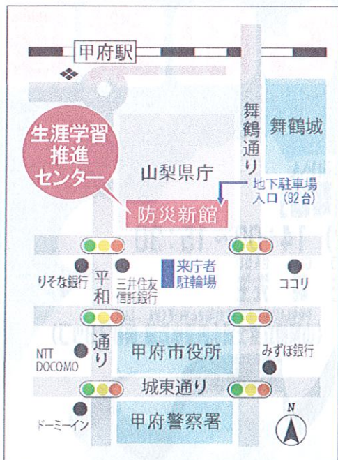
山梨県生涯学習推進センター 地図