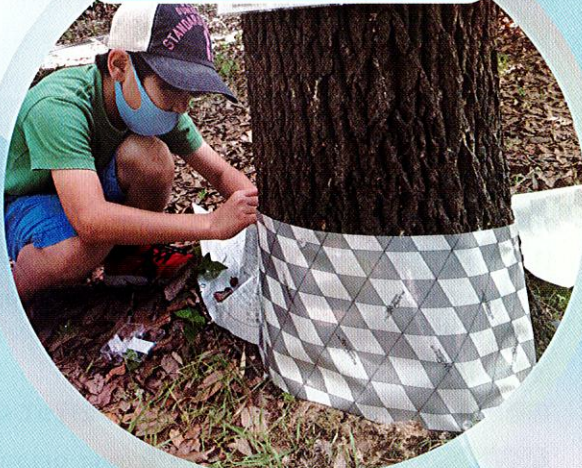
鶴二おやじたちの会 (東京都)