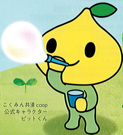
こくみん共済coop 公式キャラクター ピットくん