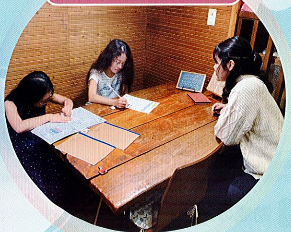
特定非営利活動法人Cafe de 寺子屋 (静岡県)