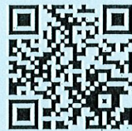
申込フォーム QRコード