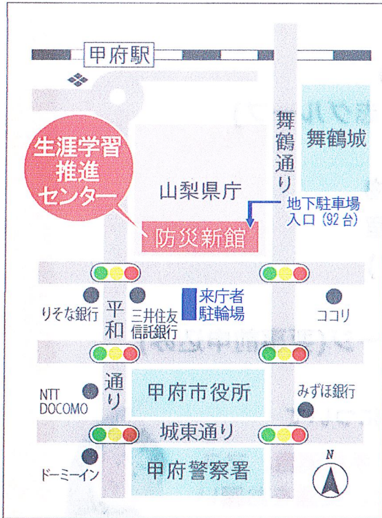
山梨県生涯学習推進センター 地図