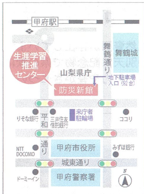
山梨県生涯学習推進センター 地図