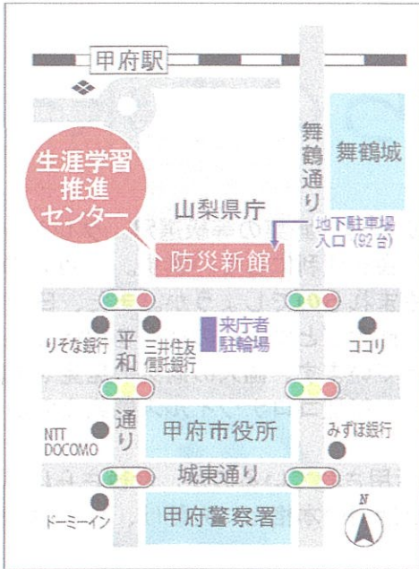
山梨県生涯学習推進センター 地図