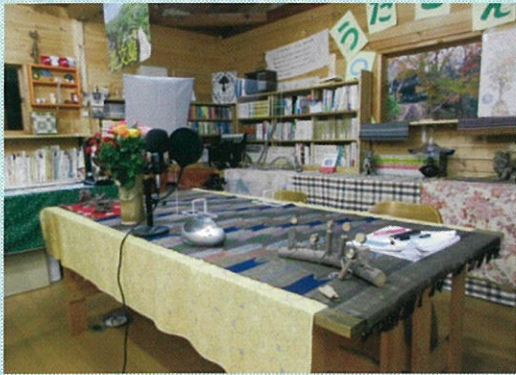
ぶどうの会交流会オンラインスタジオ