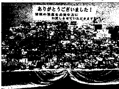
(写真はご寄付いただいた食品と生活用品の一部です)

令和5年度も同取組を実施してまいりますのでご協力のほど、よろしくお願い申し上げます。