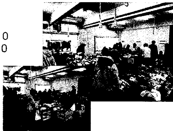
(写真は、昨年度に開催した「おゆずり会」の様子です。)

○譲渡物品：就学前(0~6歳)の乳幼児が使用する物品 服(130cmまで)、帽子、靴(19cmまで) 下着(未使用)、紙オムツ(未開封) 子ども用寝具、ベビーソファ など