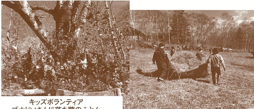
キッズボランティア ブナじいさんに落ち葉のふとん