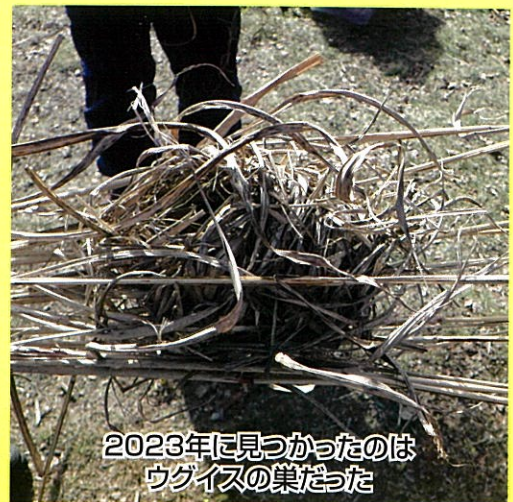
2023年に見つかったのは ウグイスの巣だった

カヤネズミは草原に住む日本最小のネズミ。 乙女高原にいるかも。巣が見つかるかな。