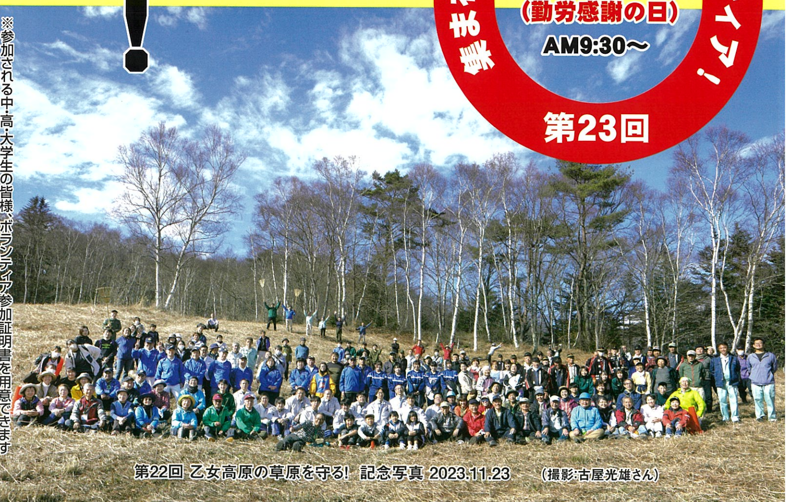
第22回 乙女高原の草原を守る! 記念写真 2023.11.23