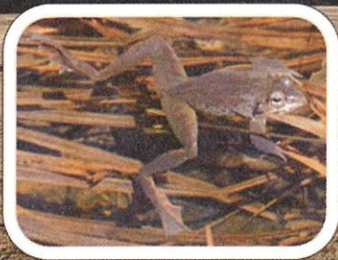
ヤマアカガエルの産卵